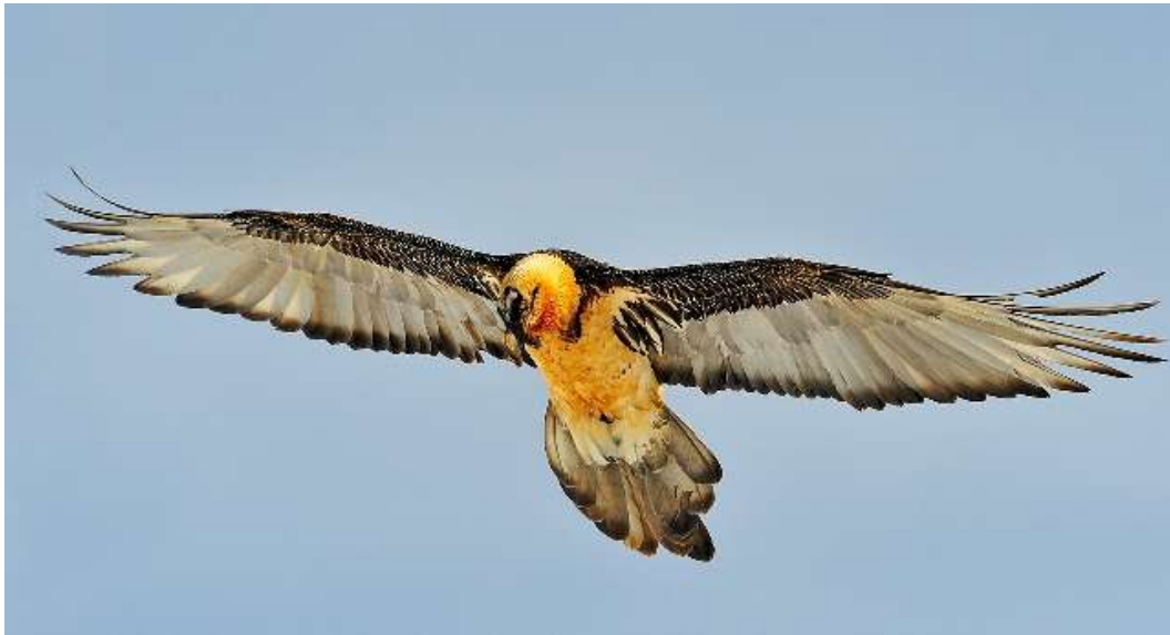
Foto: Hansruedi Weyrich, Portrait Bartgeier (1): Alpenzoo Innsbruck